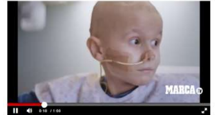
La Fundación Leo Messi hace realidad el SJD Pediatric Cancer Center

Durante todos estos años se ha apoyado cerca de 4.300 niños y niñas con discapacidad intelectual con proyectos específicos que luchan contra la discriminación social. No obstante, debido a la pandemia por covid, no han podido realizar estos últimos meses todas las competiciones.