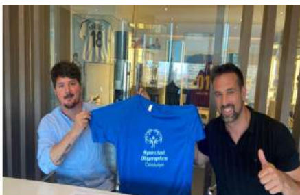
Rodrigo Messi i Sergi Grimau han signat la renovació del conveni

La Fundación Leo Messi i Special Olympics Catalunya seguiran treballant un any més a favor de la inclusió social i millora de la qualitat de vida dels nens i nenes amb discapacitat intel·lectual i també de les seves famílies, mitjançant l'esport i activitats.