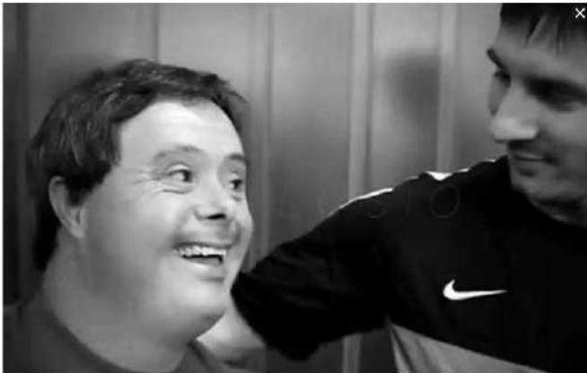
Messi, siempre volcado con Special Olympics | sport

» La colaboración entre ambas entidades arrancó en el año 2015 » El proyecto ha dado apoyo a unos 4.300 niños con discapacidad intelectual